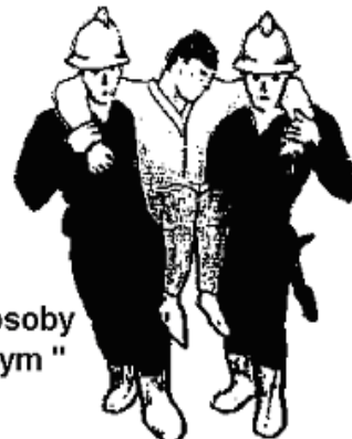
Przenoszenie przez dwie osoby sposobem " kombinowanym "