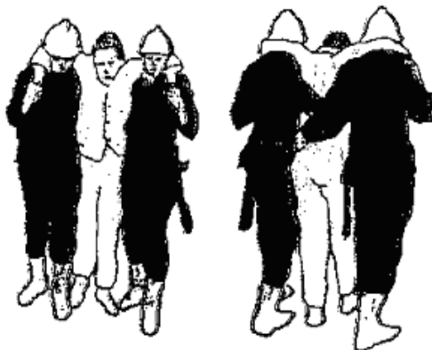
Wyprowadzanie przez dwie osoby