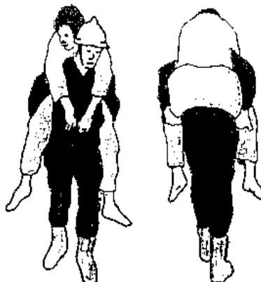
Przenoszenie przez jedną osobę chwytem "na barana"