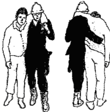
Wyprowadzanie przez jedną osobę